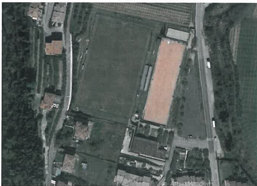
Foto aerea dell'area oggetto di intervento

Il complesso sportivo è completato da una tribuna prospiciente il campo da calcio ed il campo da tamburello ed una palazzina spogliatoi adibita sia per il calcio che per il tamburello.